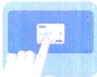
2. Pégala en la parte trasera de tu móvil.