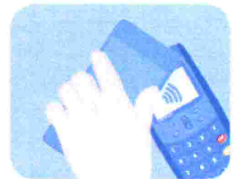
3. Paga con tu teléfono.

Accede a este enlace y descubre todo lo que podrán hacer con BBVA wallet.